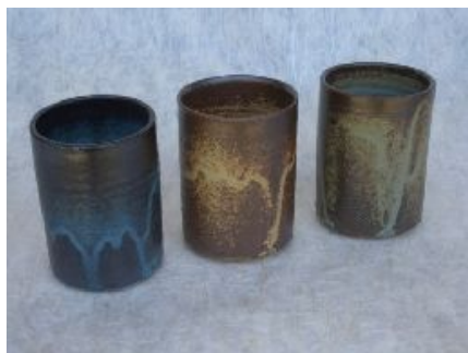
蓝、褐、茶绿 3色伊罗保釉水杯