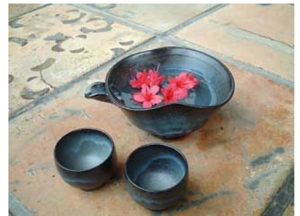
青伊罗保 单口酒器

小糸陶器以古雅的“伊罗保”釉色为主，其中色彩浓厚，极富韵味的钴蓝色“青伊罗保”是小糸特有的釉色，受到各界的高度评价。