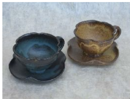
蓝、褐色 伊罗保釉花状咖啡杯

小糸制陶在高山市西部的松仓山脚设有直销店，该店位于“飞驒民俗村—飞驒之乡”附近，自然景观非常漂亮。