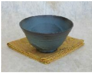
青伊罗保釉色茶碗

小糸陶器以古雅的“伊罗保”釉色为主，其中色彩浓厚，极富韵味的钴蓝色“青伊罗保”是小糸特有的釉色，受到各界的高度评价。